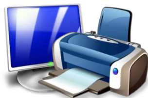
Станция печати ЭМ