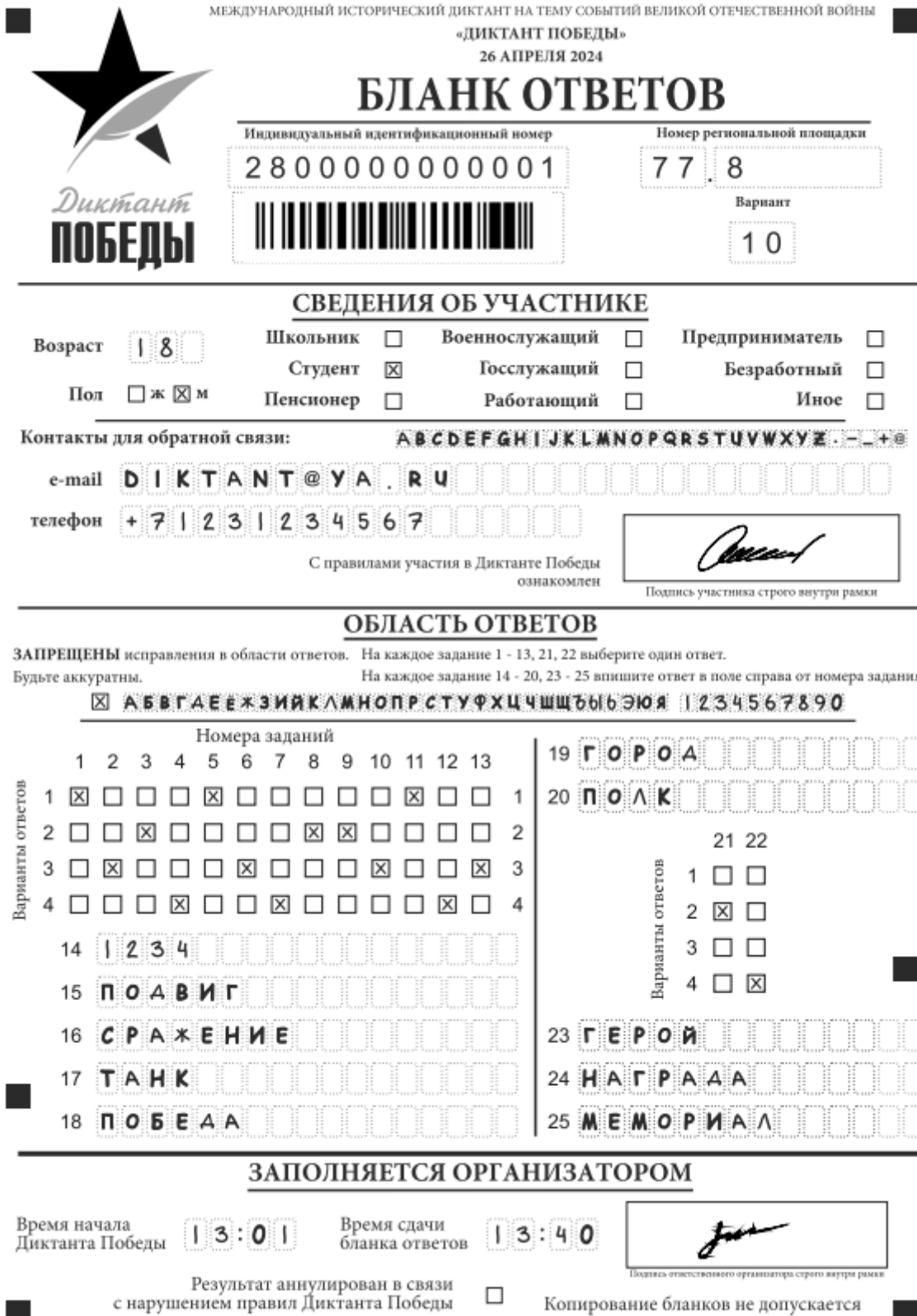
Рис. 1. Бланк ответов

По указанию организатора в аудитории участники Диктанта Победы приступают к заполнению верхней части одностороннего бланка ответа.