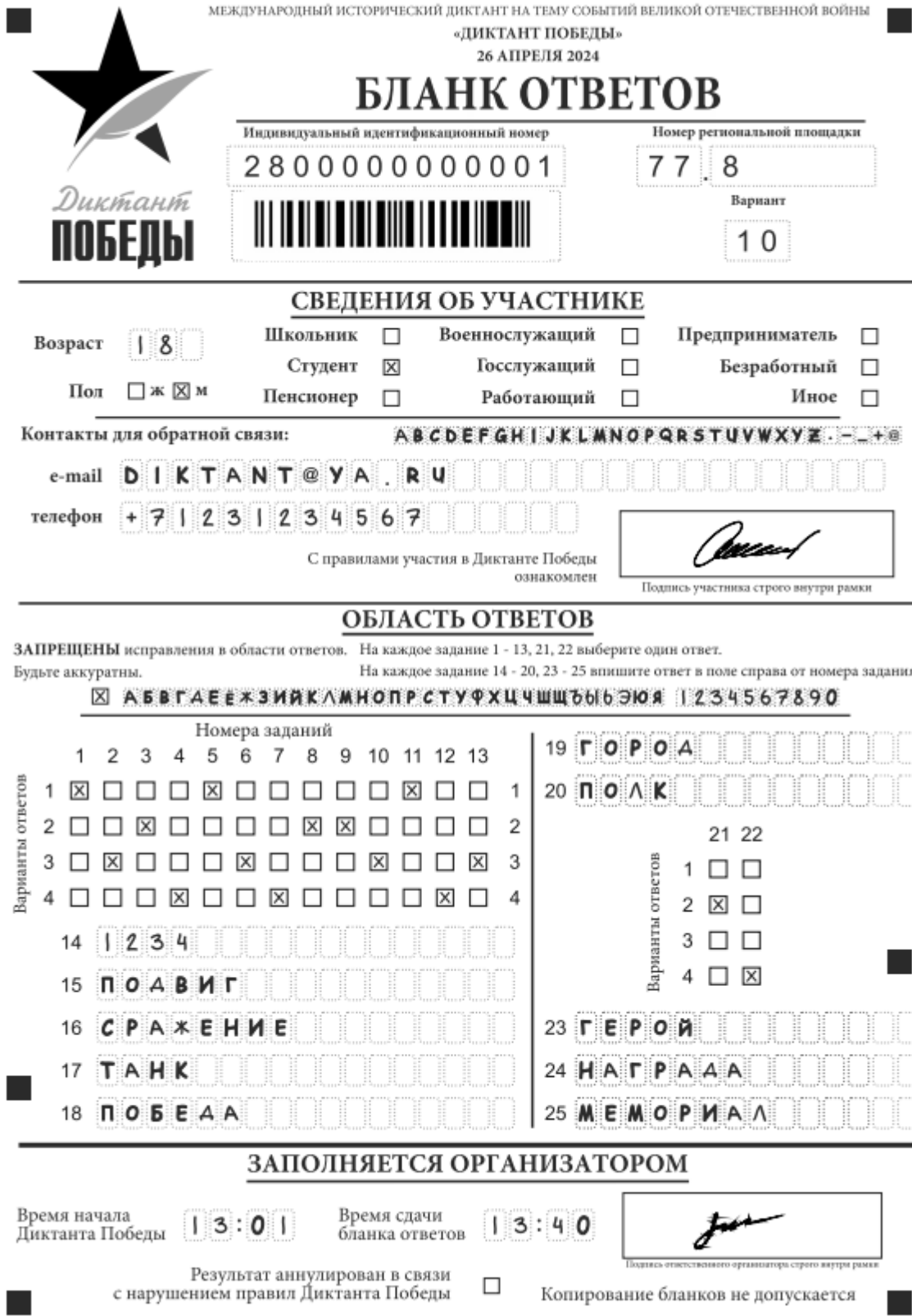
Рис. 1. Бланк ответов

По указанию организатора в аудитории участники Диктанта Победы приступают к заполнению верхней части одностороннего бланка ответа.