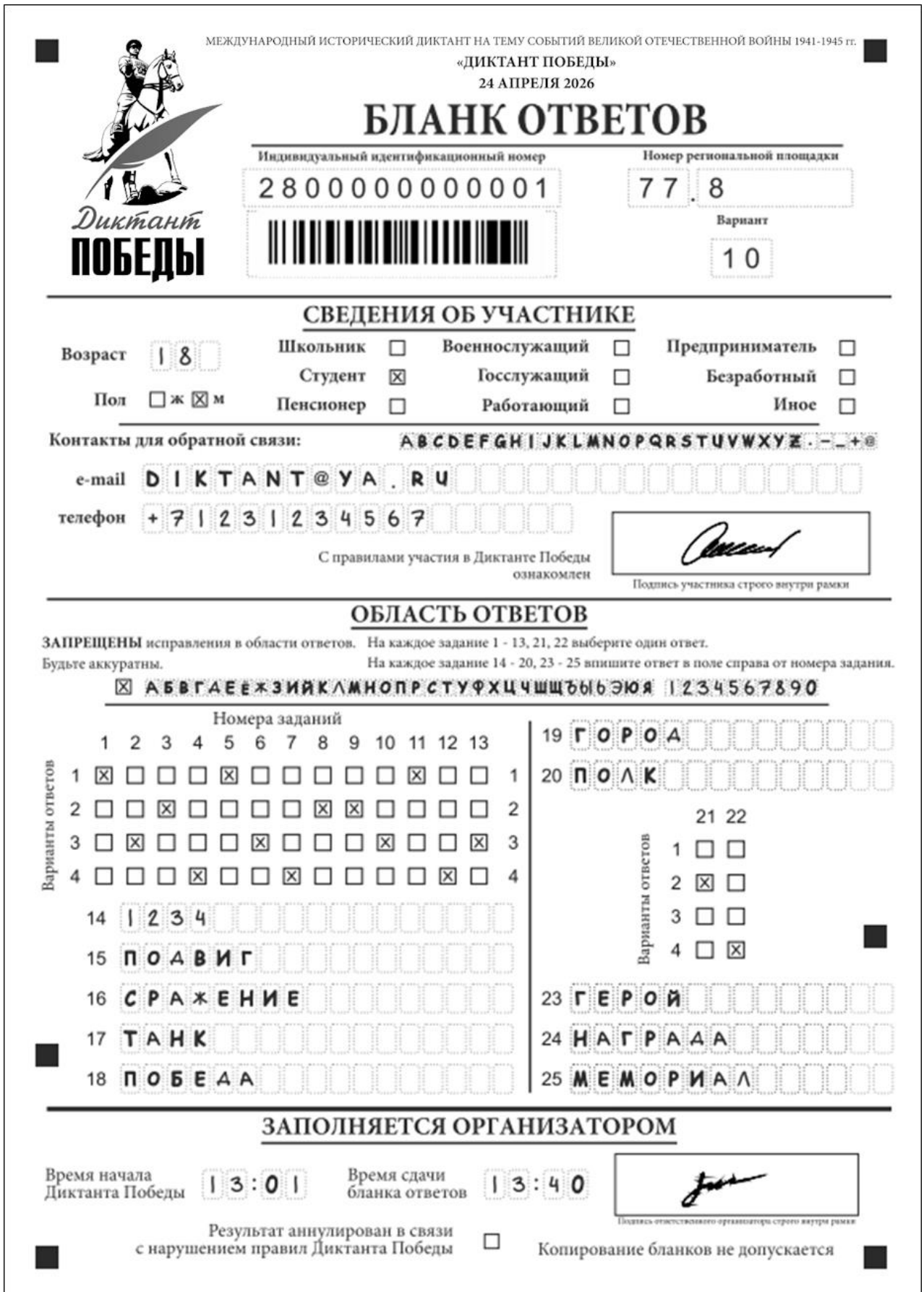
Рис. 1. Бланк ответов